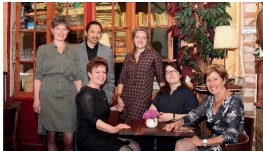
Bestuur anno 2017

Als tegenprestatie kunt u, afhankelijk van de bijdrage, denken aan vermelding op de website en/of pr-uitingen, uitnodigingen voor de prijsuitreiking en deelname aan eventuele andere literaire activiteiten.